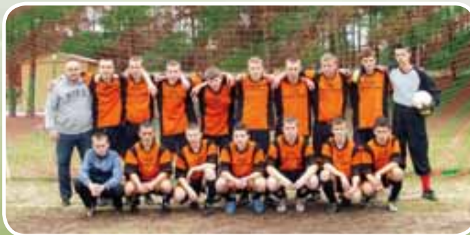
„Błękitni” Lunawy - młodsi