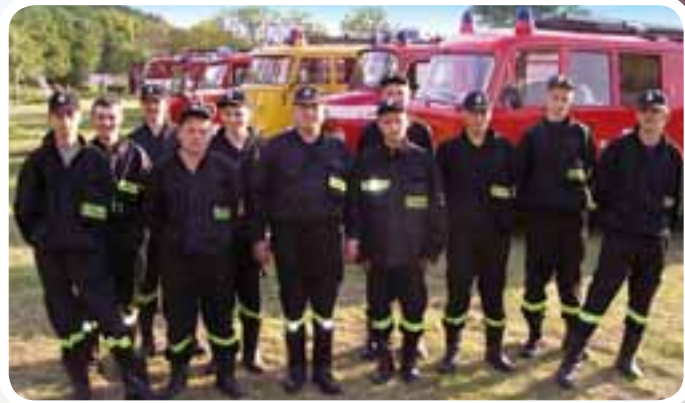
Ochotnicza Straż Pożarna w Bieńkowie