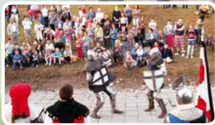
Majówka z LGD na Górze Zamkowej w Starogardzie