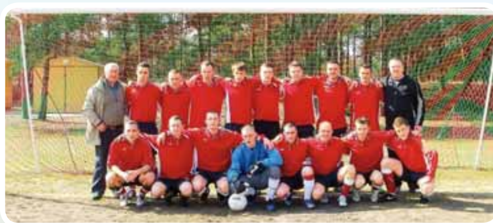
„Błękitni” Lunawy - seniorzy